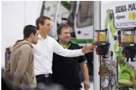
Einsatz von Schnittmodellen und Schautafeln.

Wartungspersonal an den SENNEBOGEN Maschinen geschult und weitergebildet werden. Ziel ist es, dem Kunden zu helfen, seine Maschine noch besser einzusetzen, Stillstand- und Ausfallzeiten zu minimieren und etwaige Probleme schon frühzeitig zu erkennen und zu beheben. Zukünftig sollen