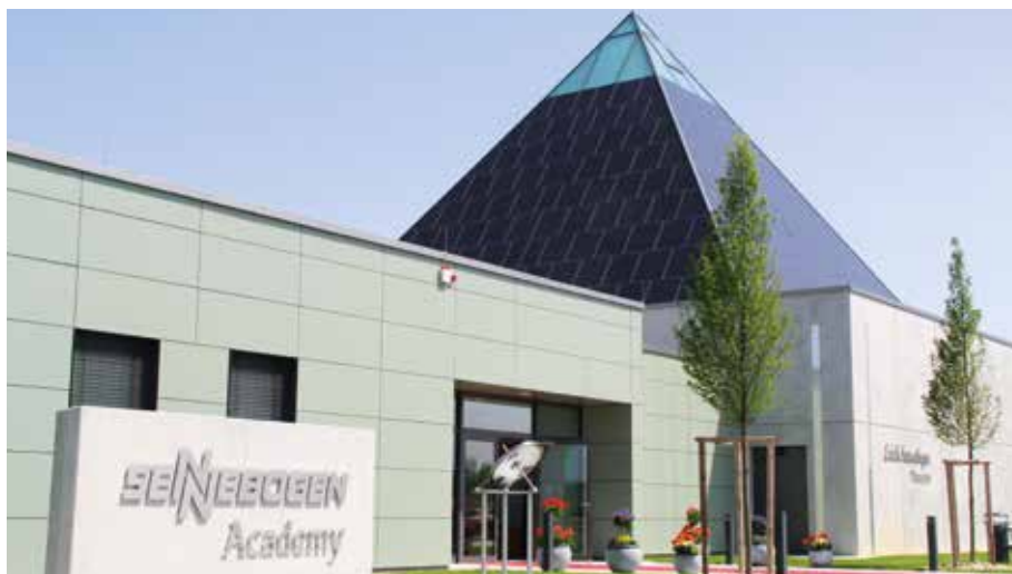
Die neue SENNEBOGEN Akademie durften Gäste, Händler und Mitarbeiter als erste entdecken. Neben Schulungen und Trainings bieten die Räumlichkeiten auch Platz für Veranstaltungen und Events.