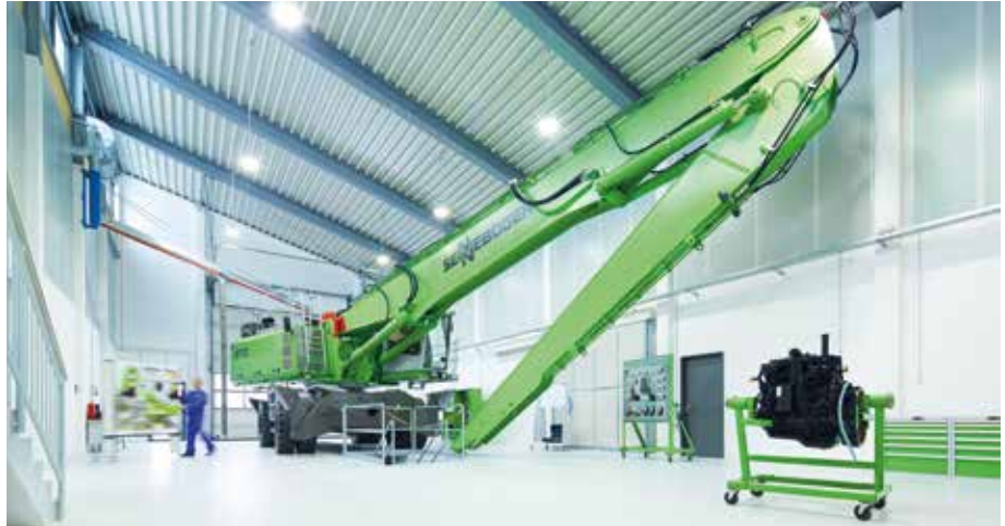
Praxisschulung in den großzügigen Hallen.

Ob Mitarbeiter-, Händler- oder Kunden-schulungen, die ersten Teilnehmer zeigten sich stets beeindruckt von den großzügigen Schulungshallen. Bis zu einer Kapazität von 5.000 Trainingsmanntagen jährlich können dort Servicetechniker, Monteure und