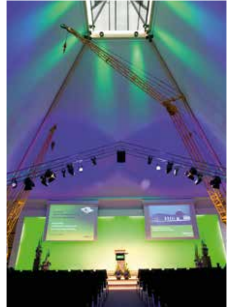
Eindrucksvolles Ambiente unter der Pyramidenkuppel bietet das Erich Sennebogen Museum.