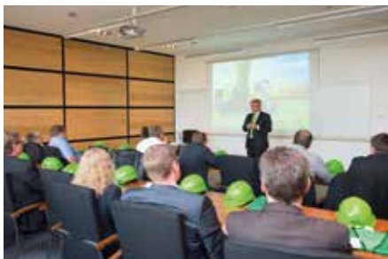
Konferenz- und Seminarräume bieten Platz für ihre Tagung und Fortbildungsveranstaltung

Bis zu 300 Personen können das hochmoderne Tagungszentrum für festliche Events und Banquette in eindrucksvollem Ambiente nutzen.