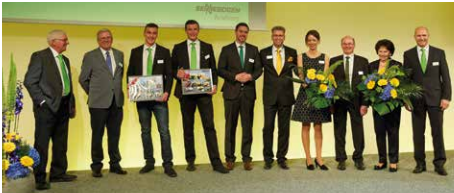
Sie alle halfen mit, das Museum zu gestalten - ein Ergebnis, das sich sehen lassen kann.

Mit der Eröffnung der SENNEBOGEN Akademie und des Erich Sennebogen Museums im Mai 2014 setzt das Straubinger Familienunternehmen einen weiteren Meilenstein in der über 60-jährigen Unternehmensgeschichte.