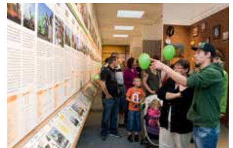
Als erste durften die SENNEBOGEN Mitarbeiter und ihre Familien die neuen Gebäude erkunden.

Als erste Gäste durften die SENNEBOGEN Vertriebspartner die historischen Exponate bewundern und Wirtschaftsgeschichte kennenlernen. Schließlich hatten die Beschäftigten bei einem Mitarbeiter- und Familientag die Gelegenheit, die neuen Räumlichkeiten zusammen mit ihren Familien zu entdecken.