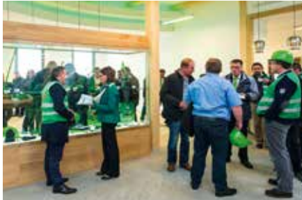
Moderne, zeitgemäße Technik und ansprechendes Design zeichnet die Räumlichkeiten aus.

Die Mischung aus Historie und modernster Technik sorgen in dem 700 m 2 großen Museum für eine besonders stimmungsvolle Atmosphäre. Dieser Eventbereich ist für interessierte Firmen, Einrichtungen, Veranstaltern und Künstlern, aber auch für private Personen buchbar.